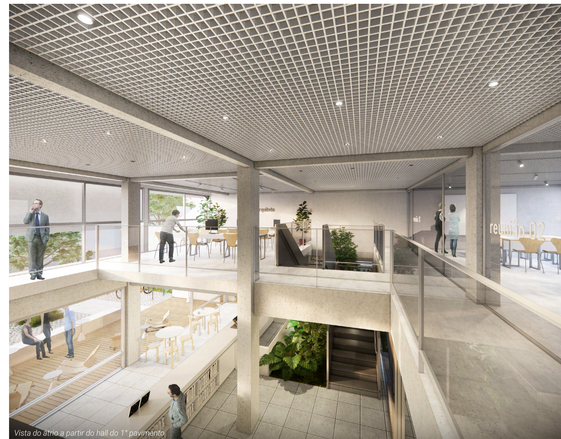
Vista do átrio a partir do hall do 1° pavimento.