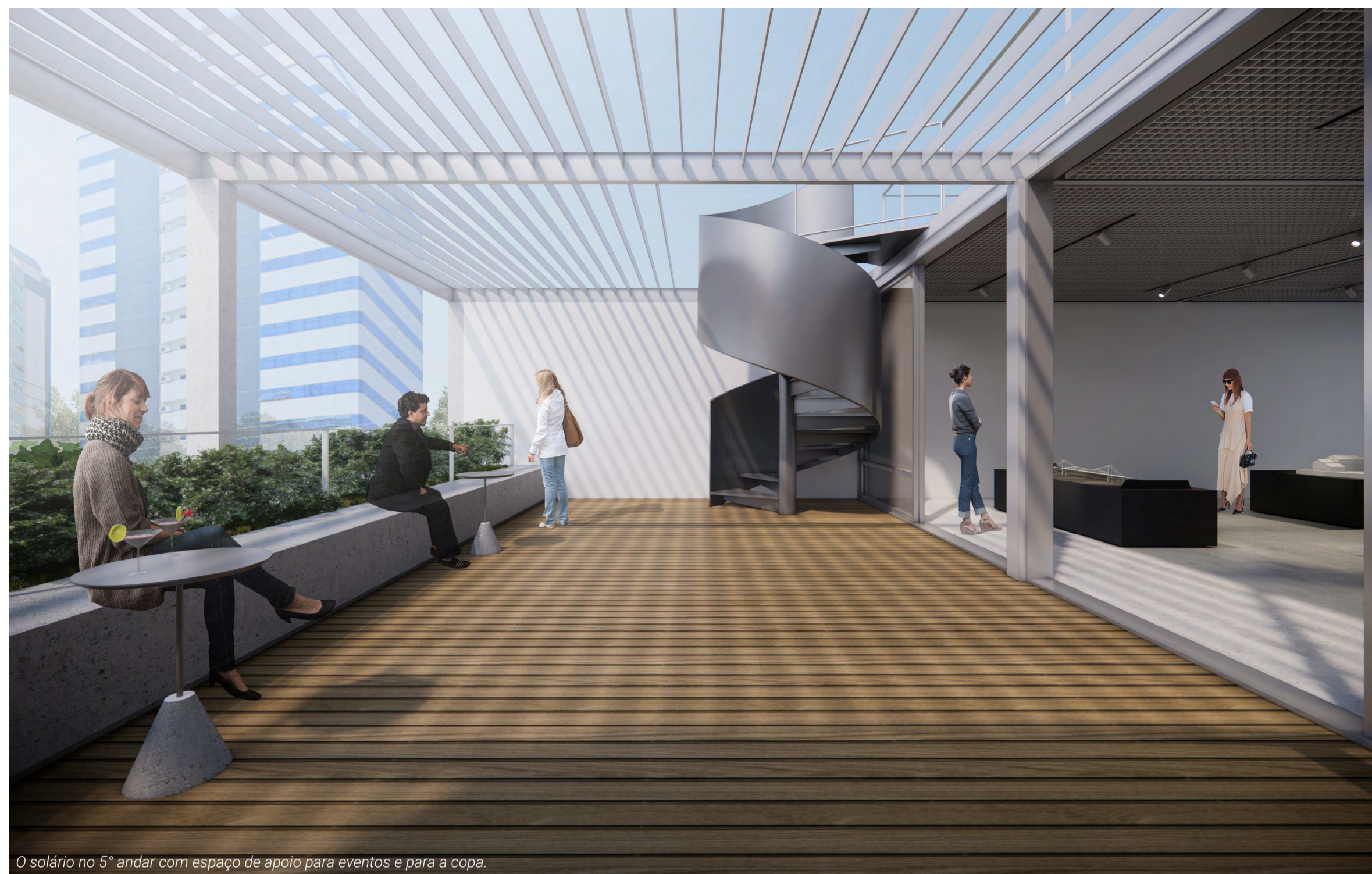
O solário no 5° andar com espaço de apoio para eventos e para a copa.