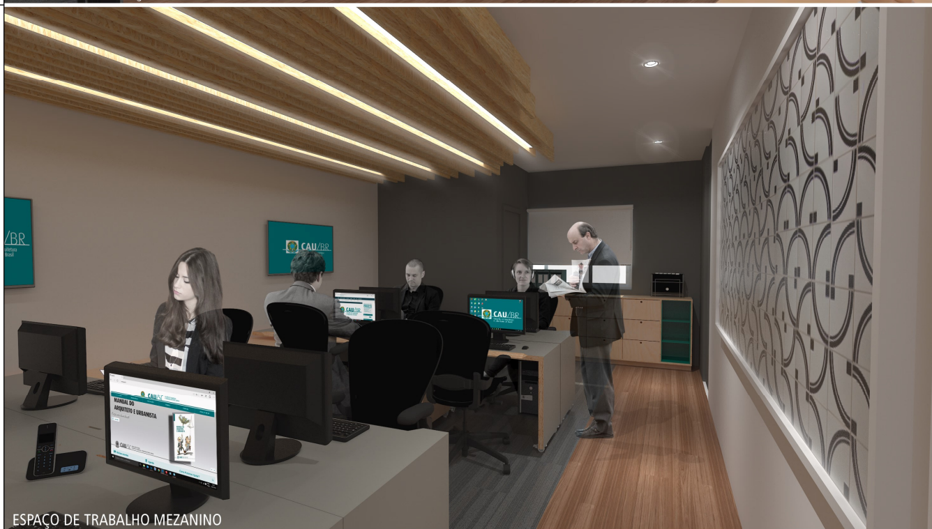
ESPAÇO DE TRABALHO MEZANINO