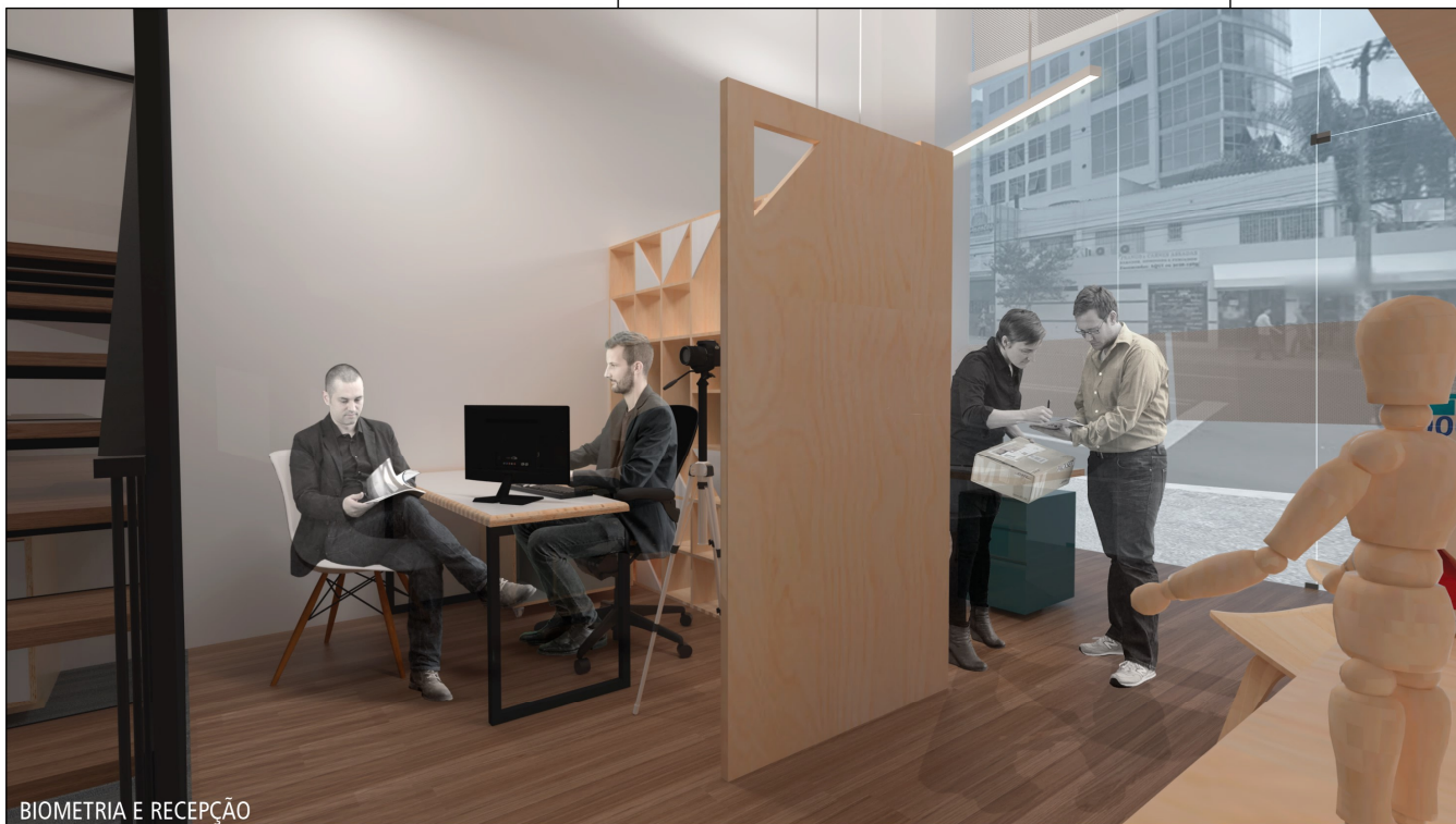
BIOMETRIA E RECEPÇÃO